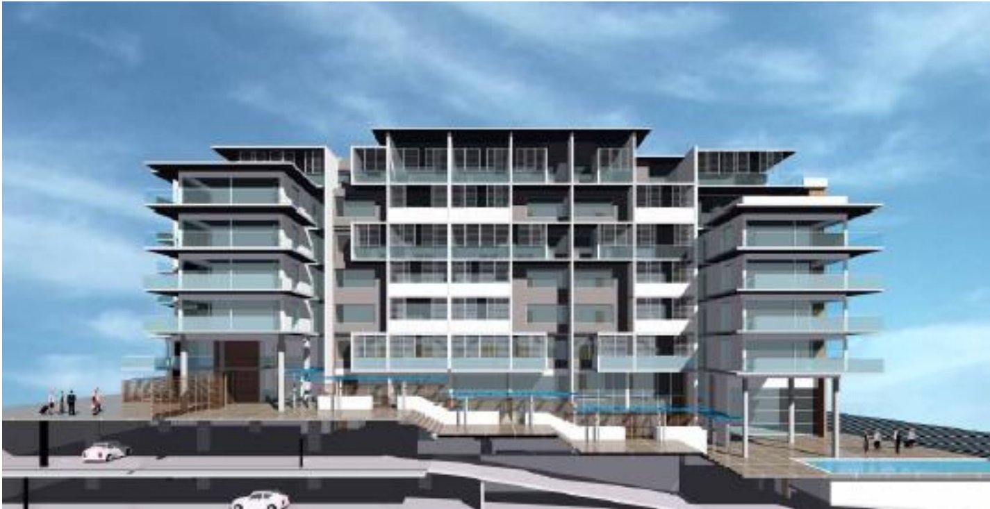
Рис. 2 Параметрическое моделирование повышает степень детализации моделей зданий. Модель на рисунке разработана австралийской компанией Architectus.

Revit обеспечивает оптимизацию процесса проектирования, позволяя архитектору выбрать наиболее эффективное проектное решение, все возможные варианты которого хранятся в одной модели. Пользователь может включить или отключить визуализацию, подготовку спецификаций и расчеты для различных вариантов проекта. Система поддерживает взаимосвязи внутри каждого варианта проекта и выполняет автоматически согласованное изменение элементов модели.